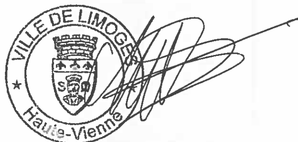
Émile Roger LOMBERTIE

Conformément au Code général des Collectivités Territoriales Formalités de publicité effectuées le 29/06/2016